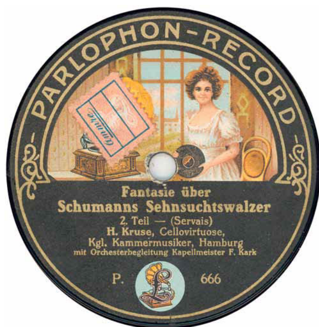
'Fantasie über Schumanns [sic] Sehnsuchtswalzer (Servais)', Parlophon 665/6 (Servaiscollectie)