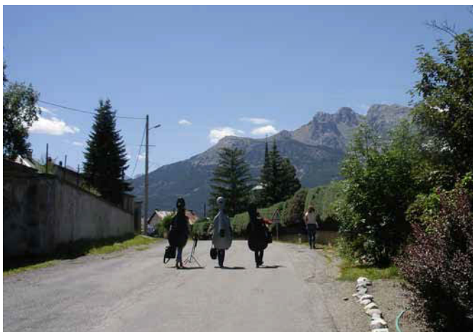
Cellokisten in het alpenlandschap