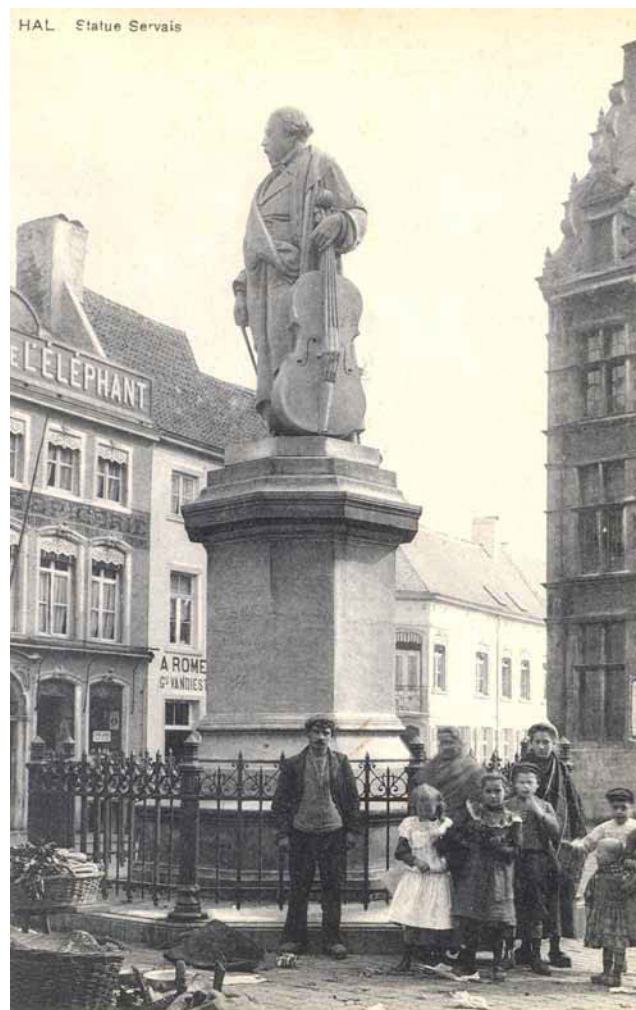
Postkaart van ca. 1910

speciaal feestbanket en er verschenen drie verschillende herdenkingsmedailles. Ook de beeldhouwer was aanwezig: Cyprien Godebski, Servais' Pools-Franse schoonzoon. Beelden van Godebski zijn wereldwijd verspreid en krijgen de laatste tijd meer en meer belangstelling.