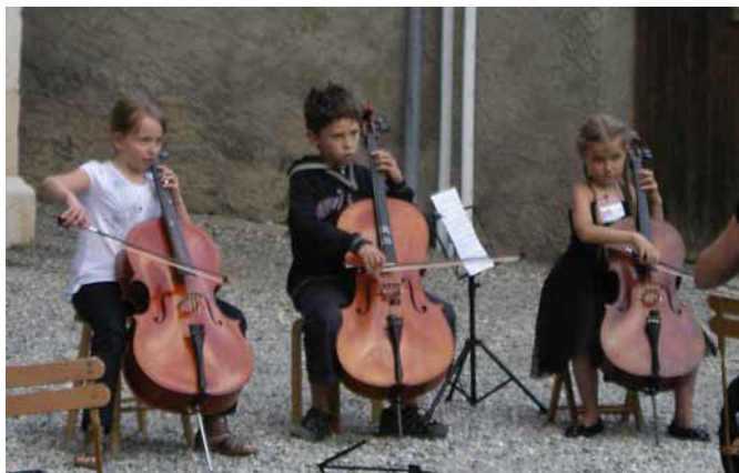
Jonge cellisten aan het werk

– 7 tot 77 jaar – en alle niveaus – prille begin tot zeer gevorderd – kwamen aan bod. De apotheose was er op het slotconcert: de kerk van Villard-Saint-Panrace was tot de nok gevuld voor de uitvoering van een fragment uit Don Carlos van Verdi en de wals van Sjostakovitsj door een ensemble van wel vijftig cellisten en één contrabassist.