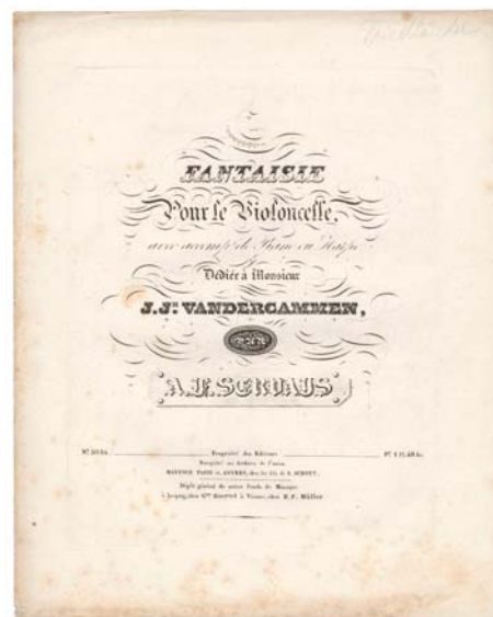
Eerste druk van Servais' Fantaisie pour le Violoncelle, opus 1 (Mainz, Schott, 1838)