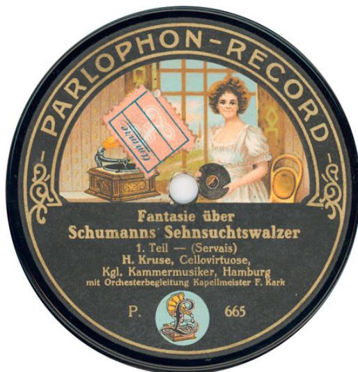
Opname van Servais' Fantaisie sur Le Désir, opus 10 (Parlophon 665/6, ca. 1911)