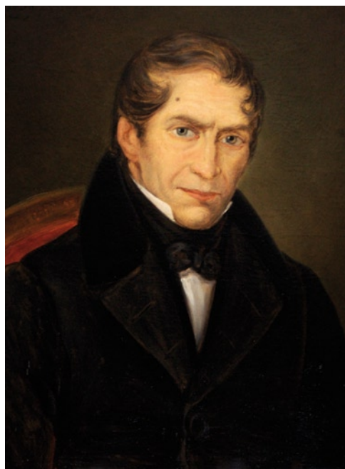
Jean Baptiste Servais in 1838, olie op doek door Jean-Joseph Delanghe (Privéverz.)

Een anoniem auteur beschreef in 1833 Halle als "[une] petite ville où il n'y a presque pas de ressources en musique". 64 Toch had Halle als een van de eerste steden een harmonie, vermoedelijk