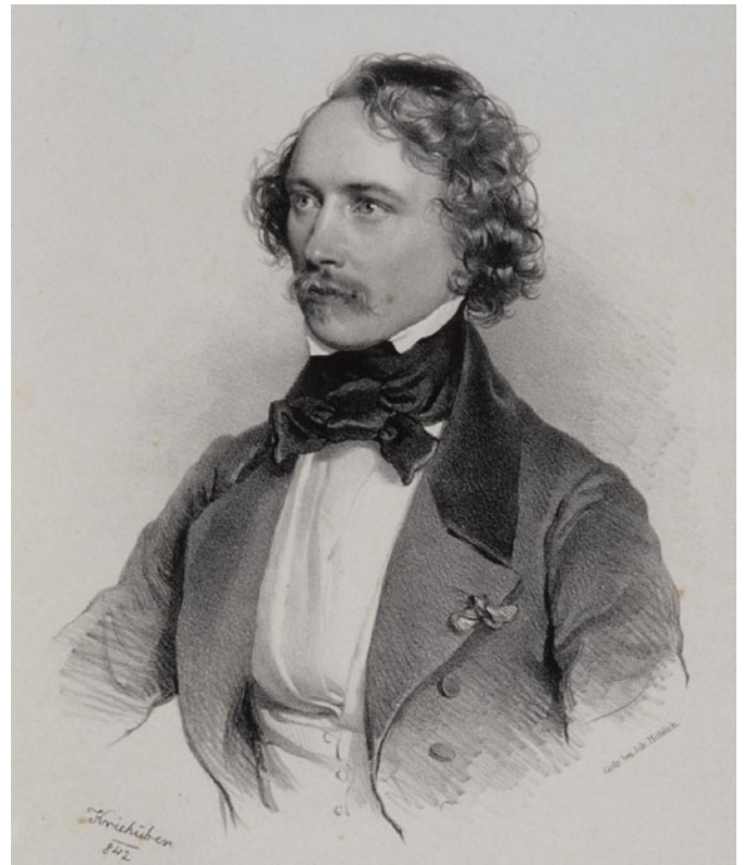
Het overbekende portret van François Servais door Josef Kriehuber, Wenen, 1842

Totnogtoe doken drieëndertig verschillende afbeeldingen van Servais op: twee schilderijen, twee gravures, negen tekeningen/aquarellen, acht lithografieën en twaalf foto's. Wie vindt de vierendertigste afbeelding?