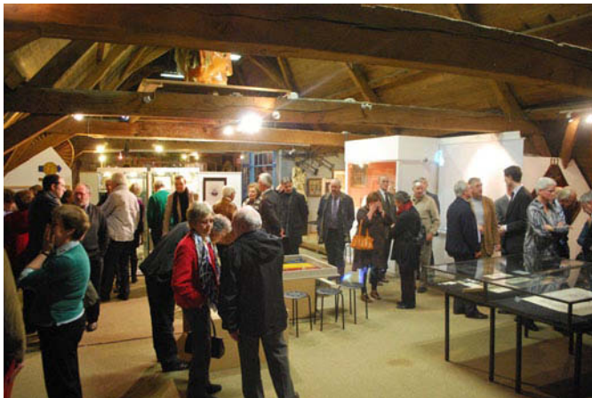
Vernissage van de tentoonstelling op 21 april 2012

Van 22 april tot 31 oktober loopt er een grote expo over Conscience in de Zennevallei in het Zuidwestbrabants Museum. De expo belicht Consciences lange verblijf in Halle in 1881, zijn verkenning van de Zennevallei, het artistieke leven van schoonzoon Gentil Antheunis en Consciences nagedachtenis.