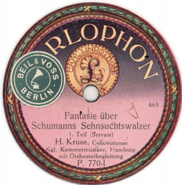
Detail van de nieuw verworven plaat (Parlophon 665/6, ca. 1920)

Minstens vijf uitgaven ontbreken nog (met een sterretje aangeduid in de discografie op www.servais-vzw.org ). Daarnaast bevat de collectie tientallen opnames die (nog) niet zijn uitgebracht.