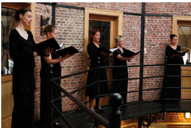
Psallentes – P.C.B. Halle

En de derde dag... begon met een aperitief in de rotonde van de voormalige medicijnenfabriek P.C.B. aan het station van Halle. In dat net gerestaureerde monument zong het vrouwenkoor Psallentes antifonen van Hildegard von Bingen ter ere van de Heilige Ursula. De stemmen kwamen letterlijk uit de hemel, want de zangeressen hadden zich opgesteld boven het publiek.