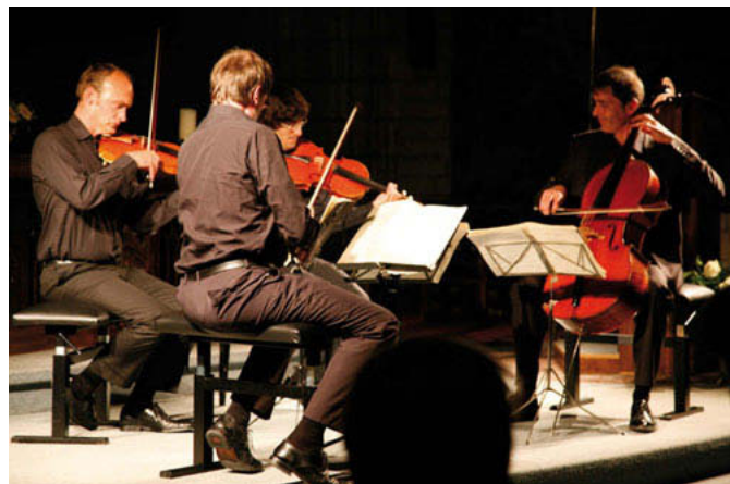
Danel Kwartet – Sint-Martinusbasiliek Halle

Het festival Weg van Klassiek! is een project van de Cultuurregio Pajottenland & Zennevallei, de Cultuur- en Gemeenschapscentra Vlabra'ccent regio Pajottenland & Zennevallei, Kasteel van Gaasbeek, vzw Servais en Regionaal Landschap Pajottenland & Zennevallei. Het festival kreeg de steun van de provincie Vlaams-Brabant, de cel Vlaamse Rand, Klara en diverse andere partners.