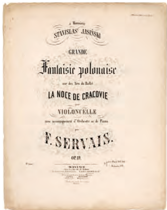
Eerste druk van Servais' Fantaisie polonaise (Mainz, Schott, 1861)

nu de Grande Fantaisie polonaise sur des Airs du ballet 'La Noce de Cracovie' , die ik later heb leren kennen: Servais zal in Polen een huwelijksfeest hebben meegemaakt, daar een paar deuntjes hebben opgepikt en in zijn geest begon een nieuwe fantasie te kiemen.