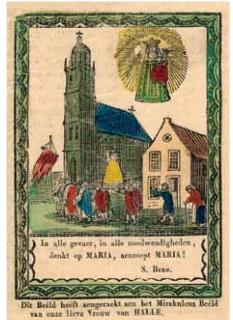
Procession in Halle, a devotion print from ca. 1820