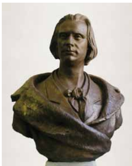
Franz Servais