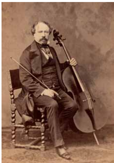
François Servais by Louis Ghémar, ca. 1862 (Servais Collection Halle)