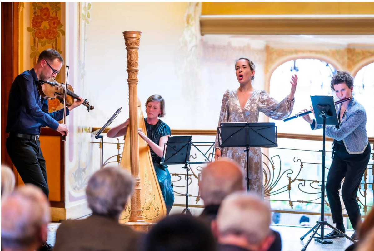
Optreden Revue Blanche op 6 oktober