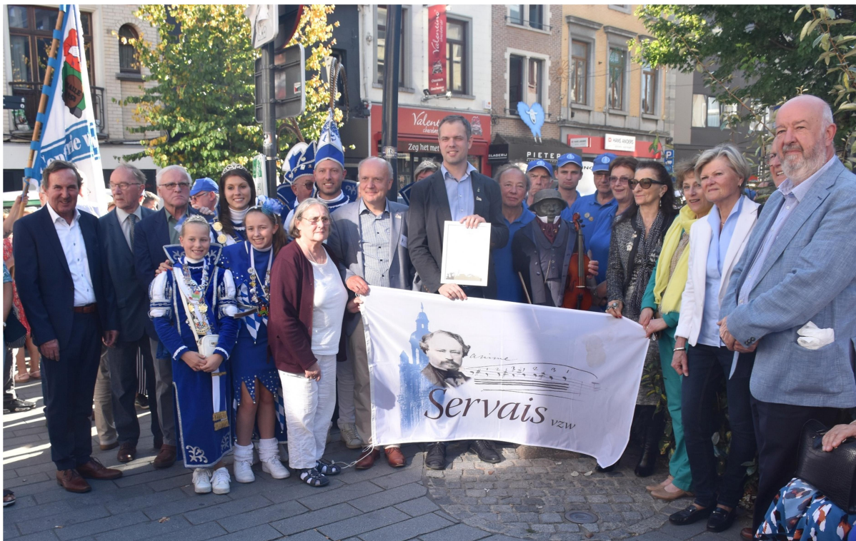
1 oktober 2023 - peterschap kleine Vaantjesboer