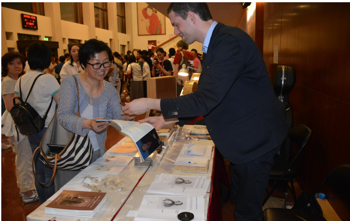
Promotie van Servais in Peking